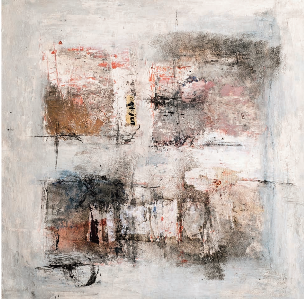
Mur-mur technique mixte sur toile 60x60 cm