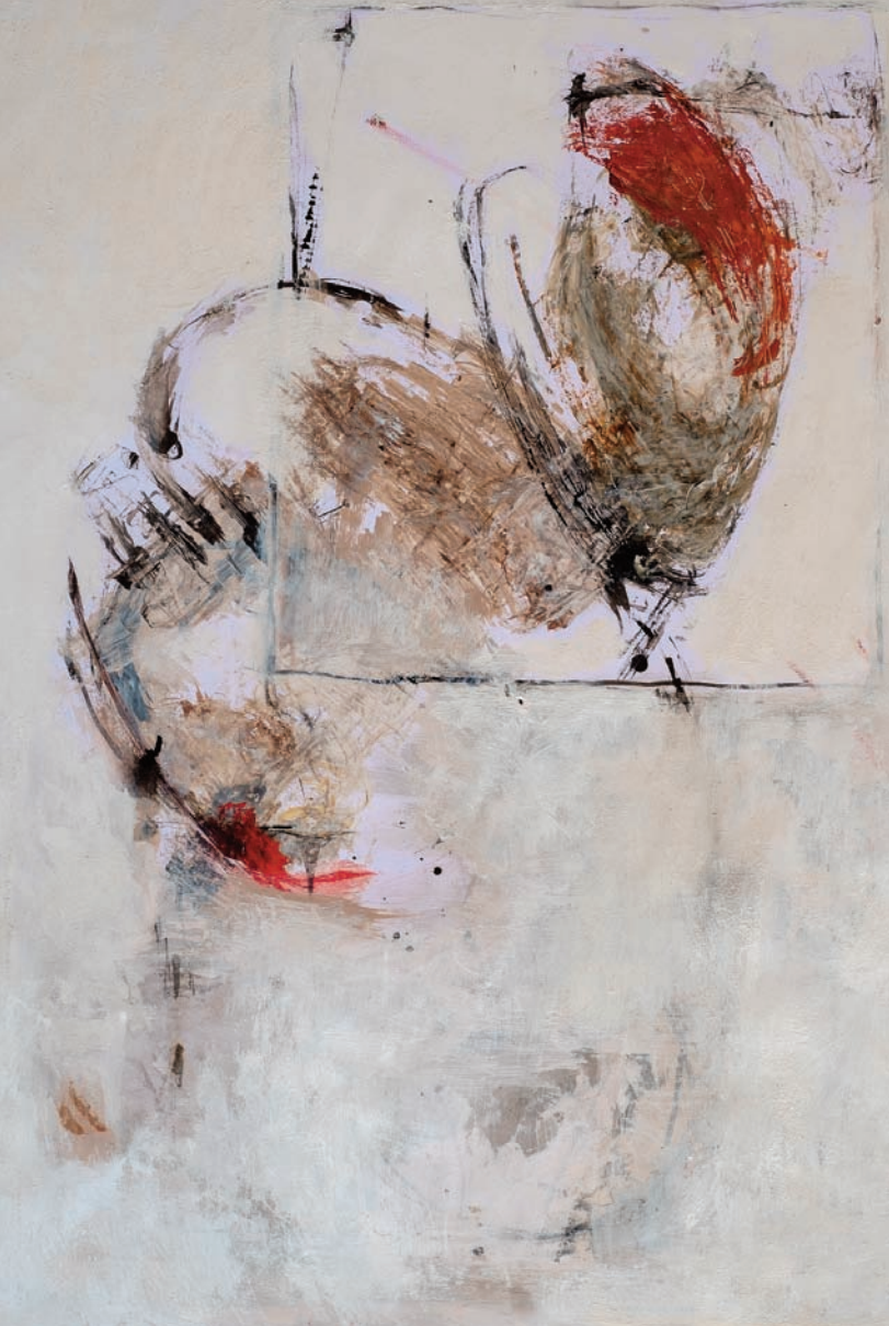
Le baiser huile sur papier 37x55 cm