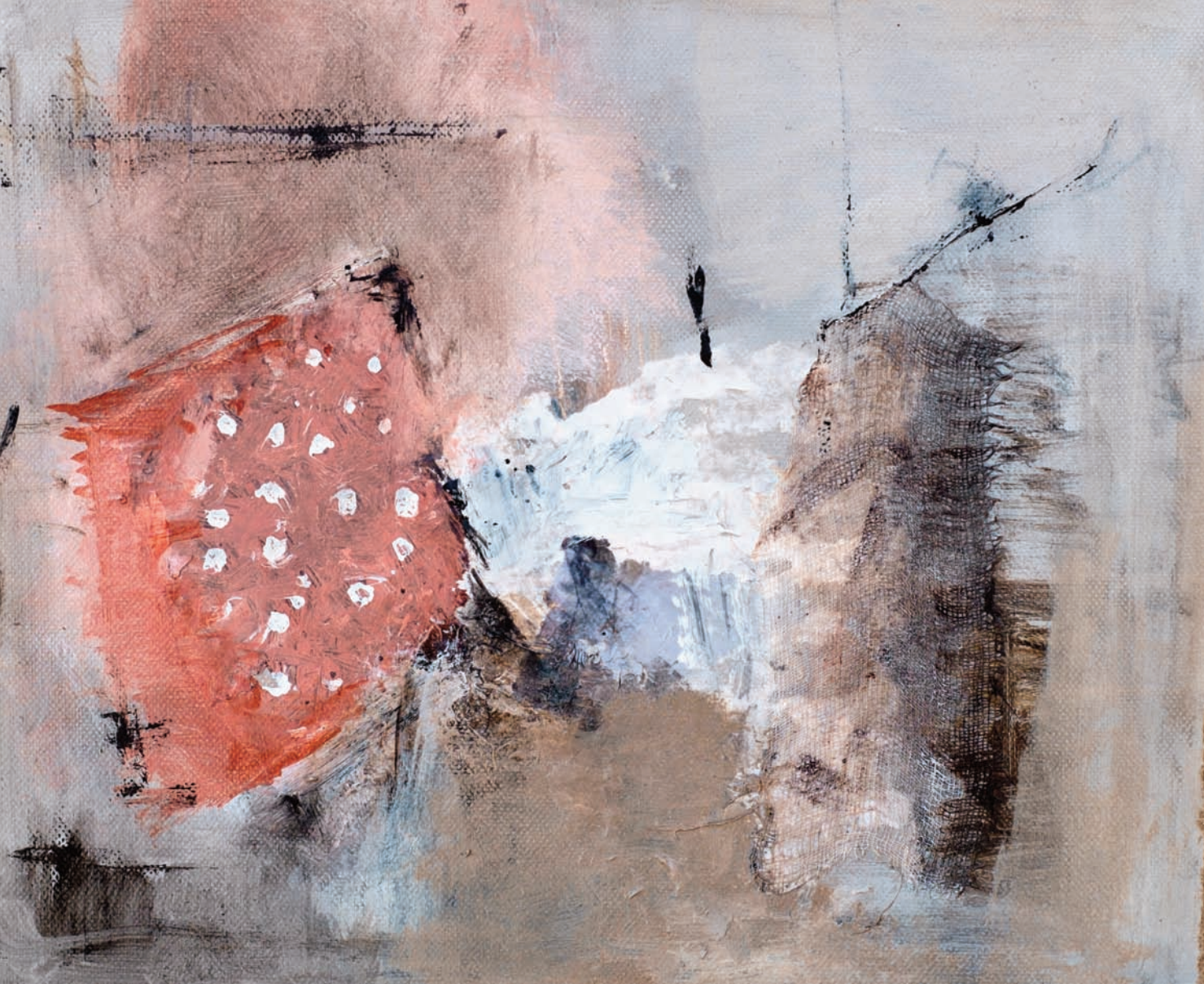
A bailar Detail technique mixte sur toile 50x70 cm