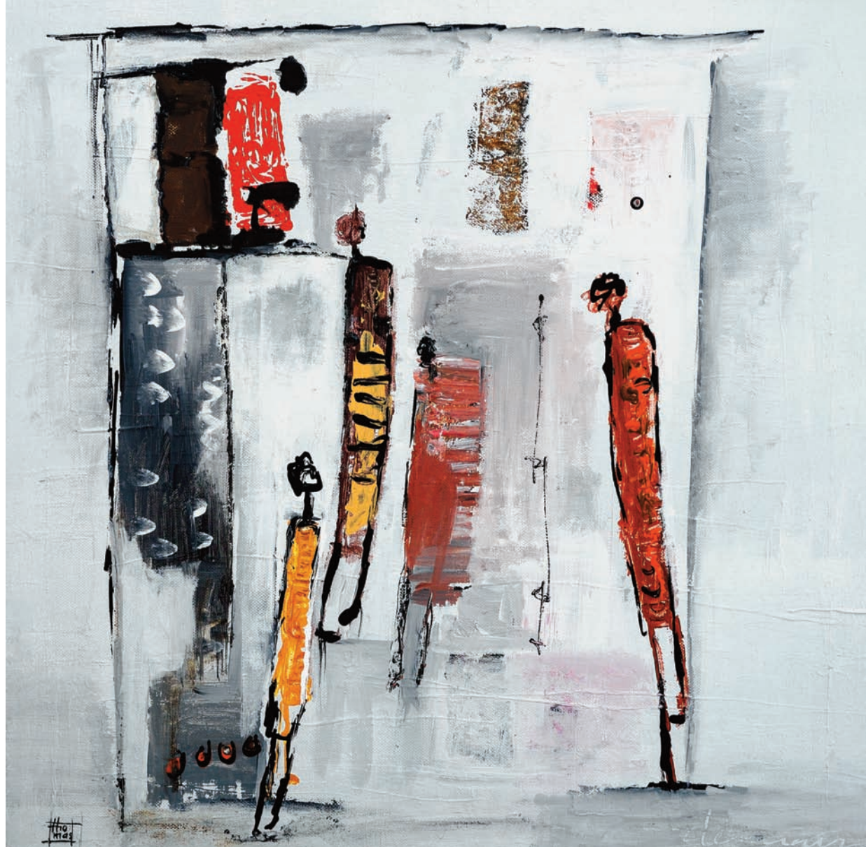
Volver technique mixte sur toile 48,5x63 cm