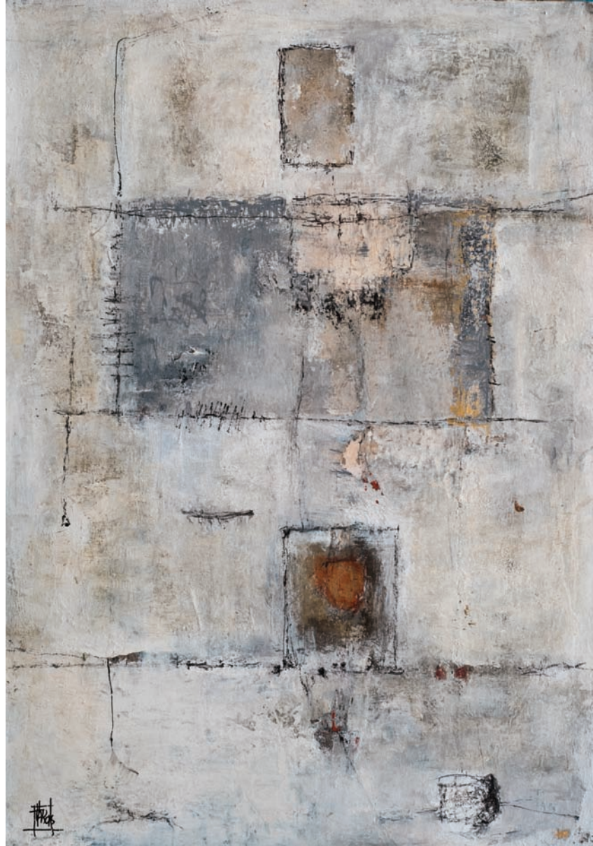
Ventanas technique mixte sur bois 53x77 cm