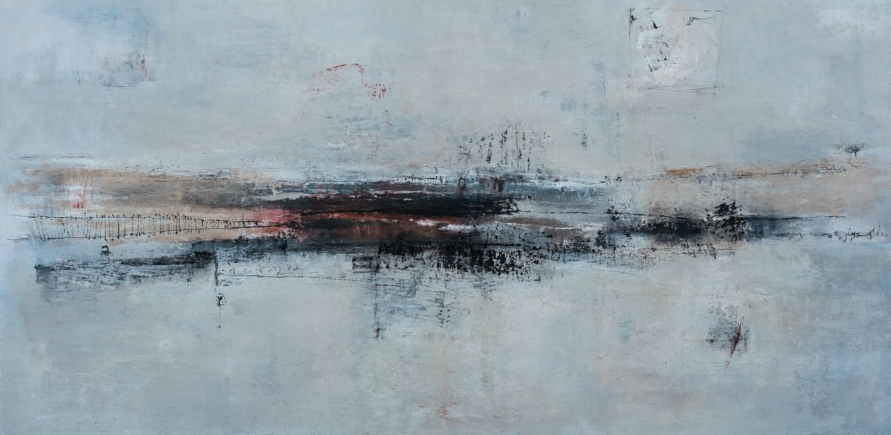
Rivage encre sur papier 120x60cm