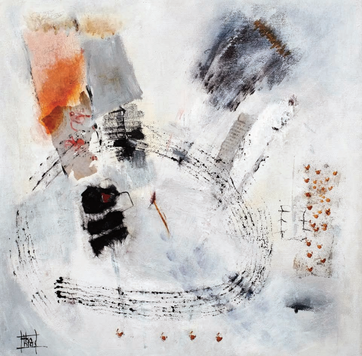
Movimiento technique mixte sur toile 40x40 cm