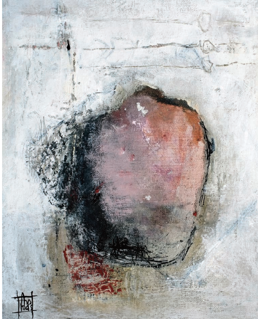
corazon technique mixte sur bois 21x27cm