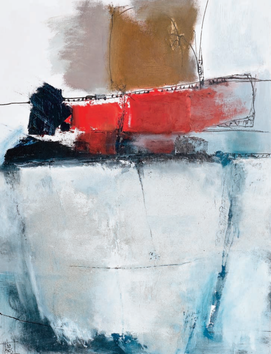
Pas que beau technique mixte sur bois 43x57 cm