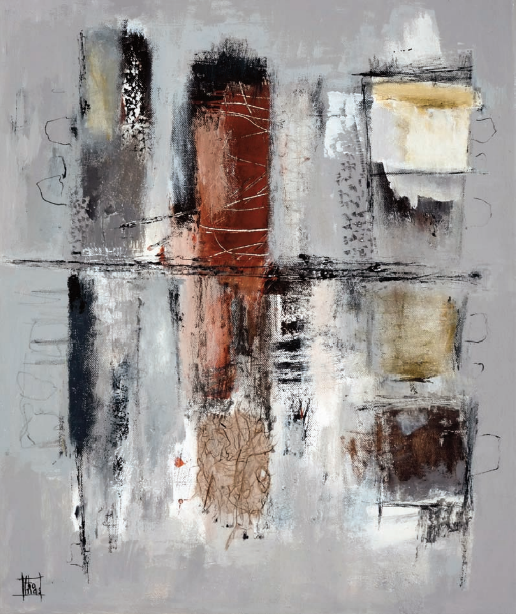
Sur le fil technique mixte sur toile 46x55 cm