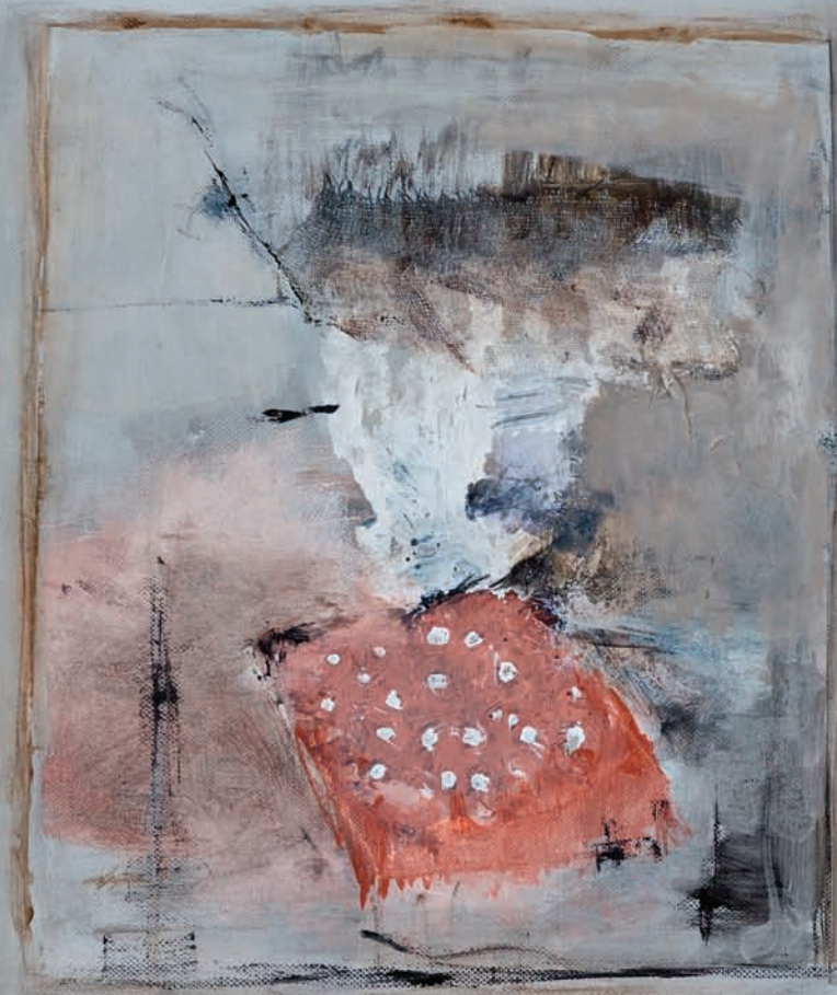
A bailar technique mixte sur toile 50x70 cm