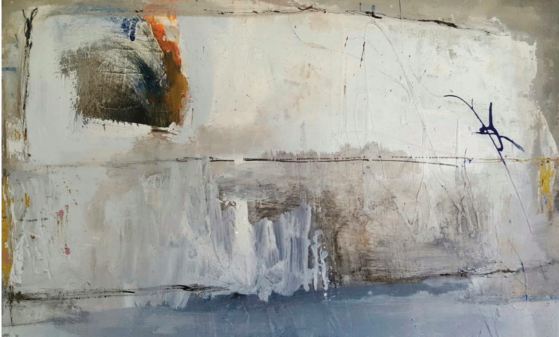
Troglodyte technique mixte sur bois 25x51 cm