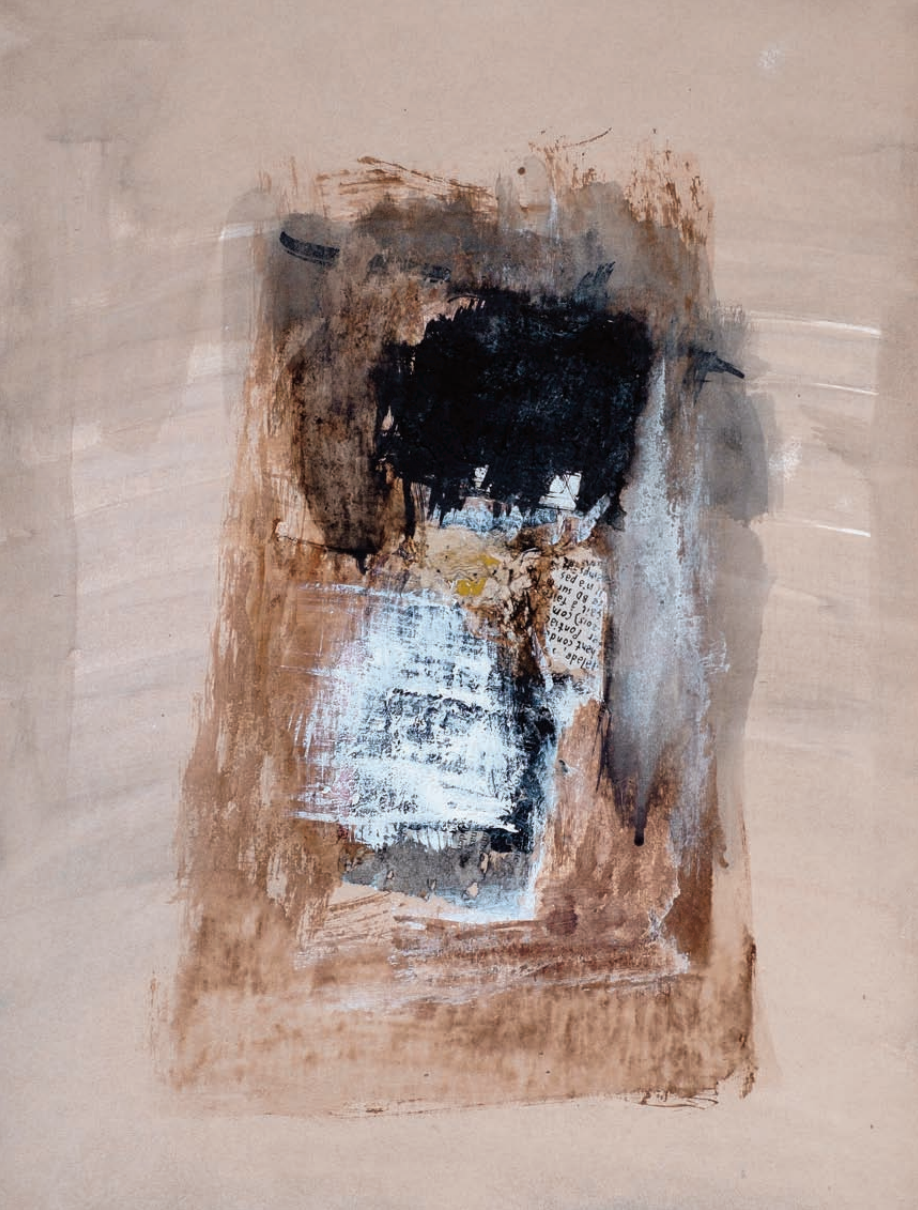
Chute tinta sobre papel 30x40 cm