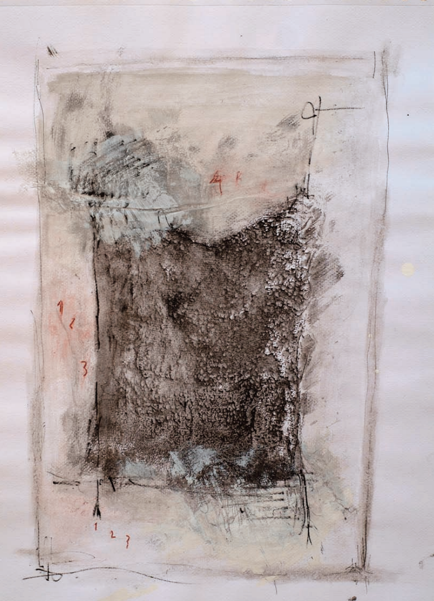
Tutu tinta sobre papel 30x40 cm