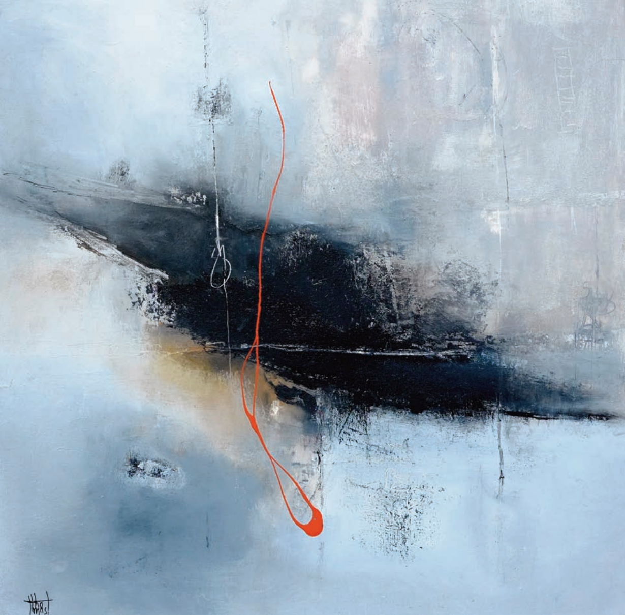
Accro technique mixte sur toile 60x60 cm