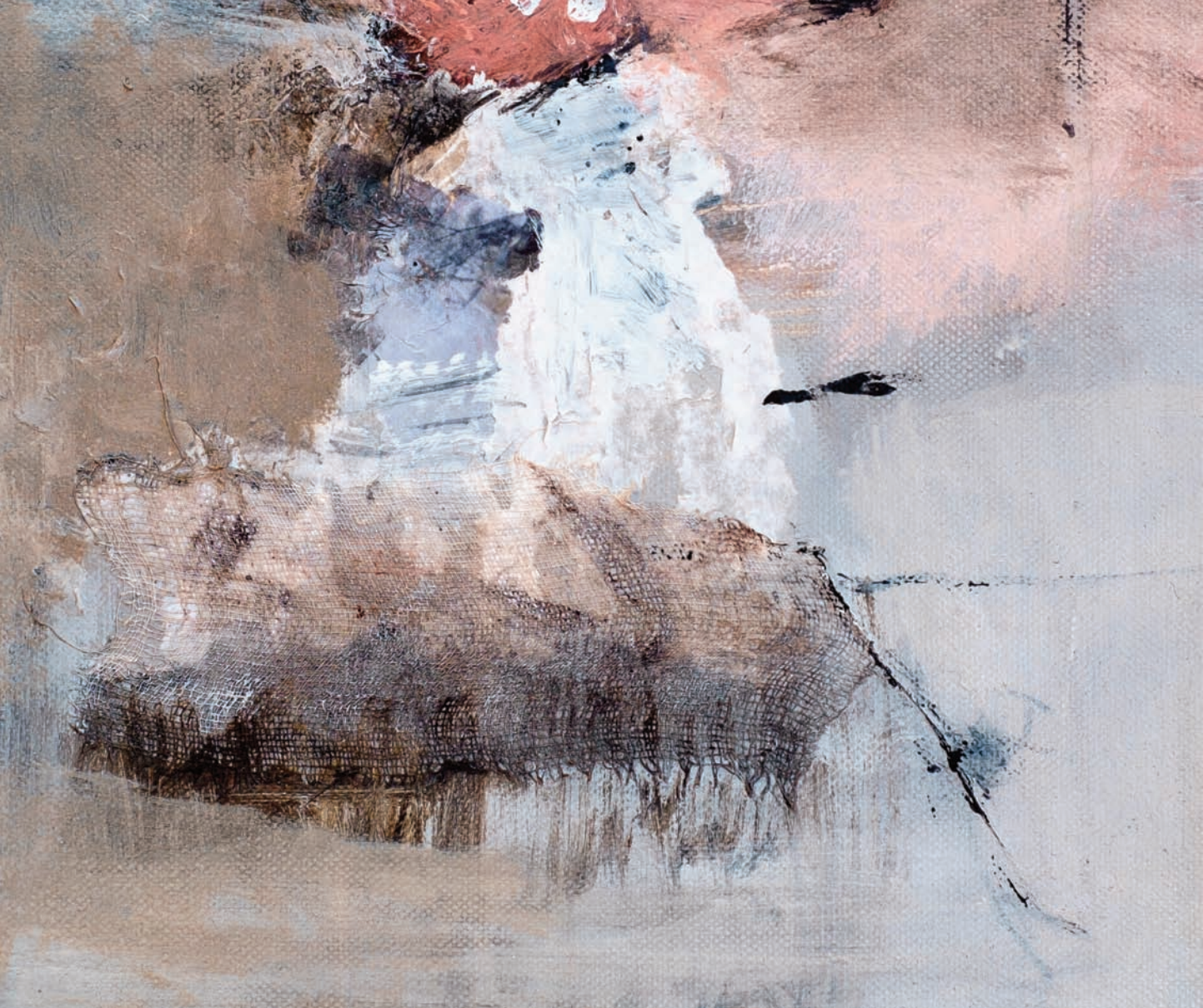
A bailar Detail 2 technique mixte sur toile 50x70 cm