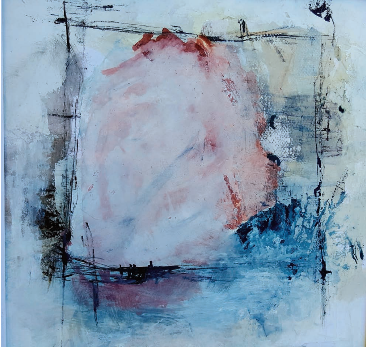
Rose tinta sobre papel 30x40 cm