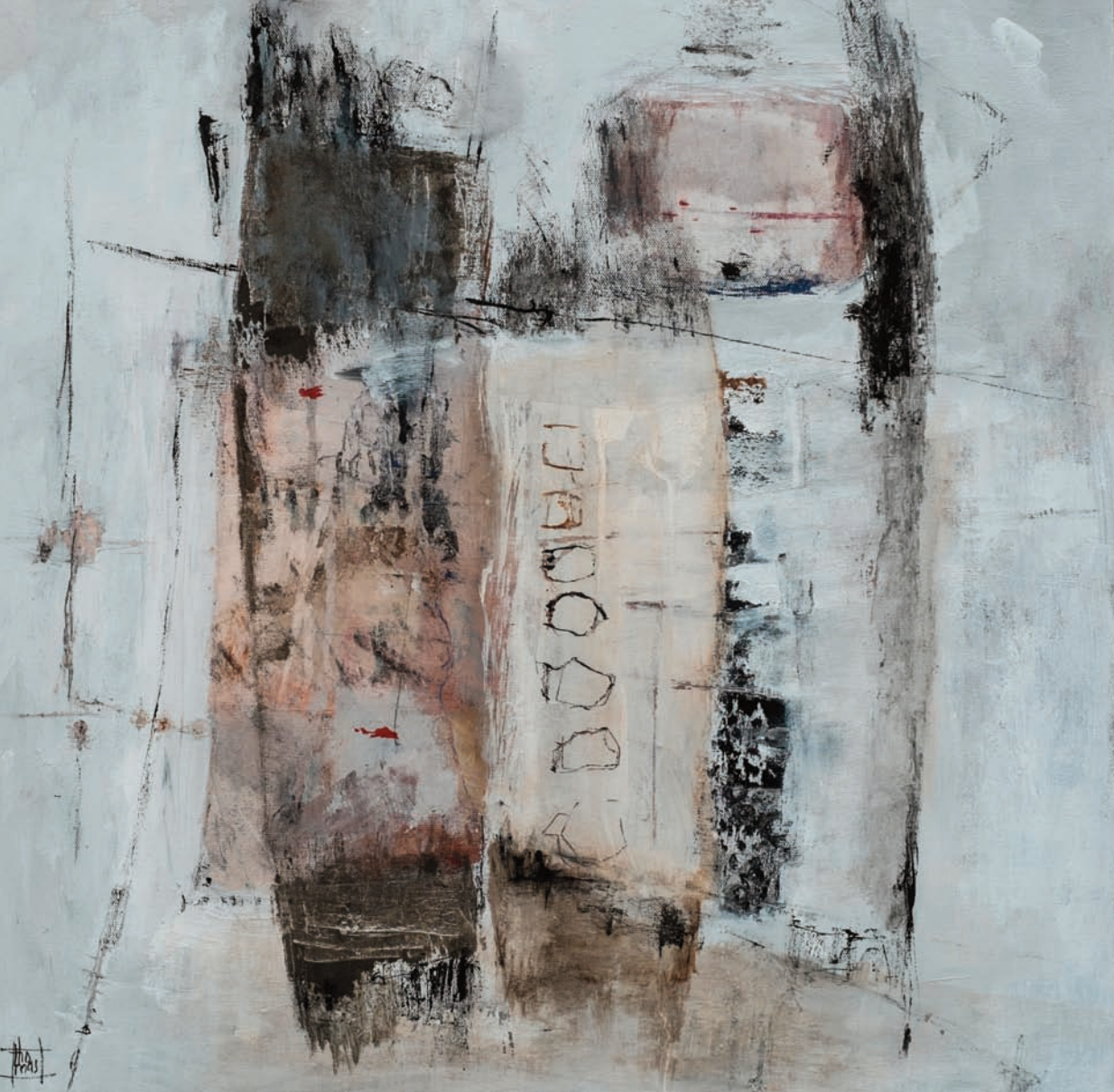
Tot'aime technique mixte sur toile 60x60 cm